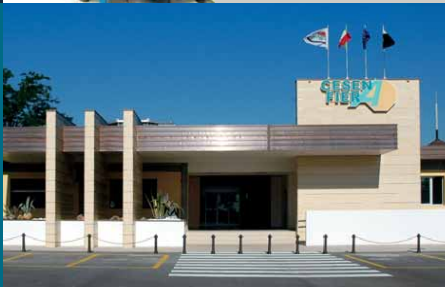
Centro Congressi quartiere fieristico